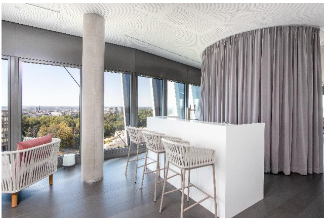
Biertheke im Gastronomiebereich der Kanzlei