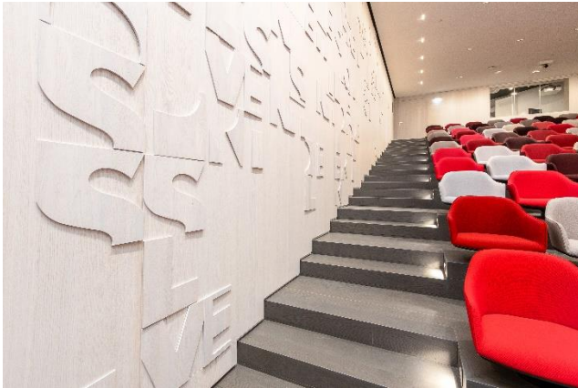
Buchstabenwandverkleidung aus Eichenholz im Auditorium der Kanzlei