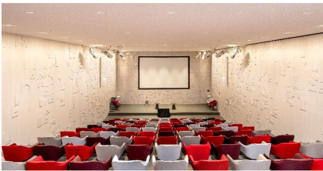
Auditorium mit effektvoller Wandverkleidung aus Eichenholz