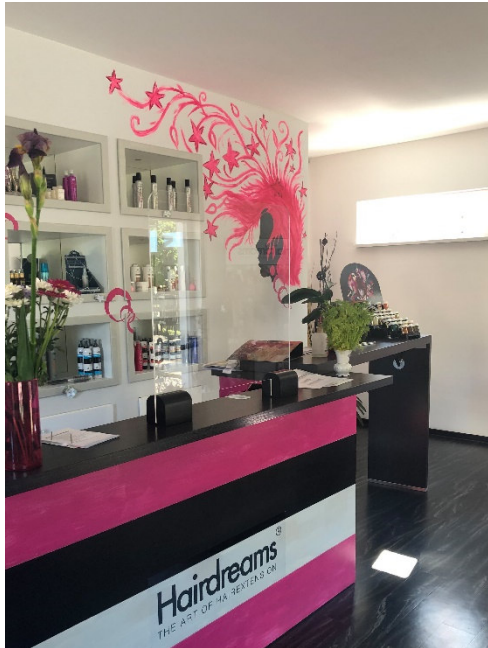
Anwendungsbeispiele in der Praxis.