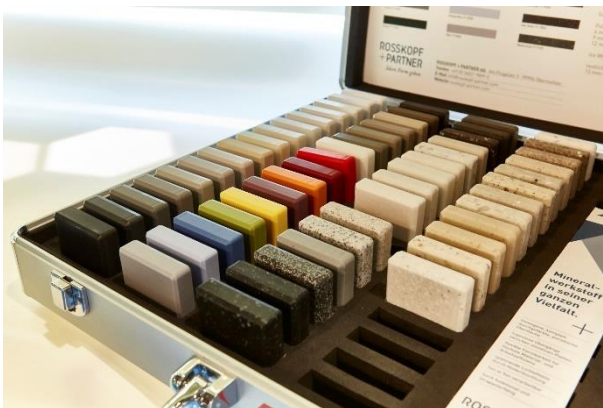
Rosskopf + Partner_92_A@W_Wiesbaden_2018_006.jpg