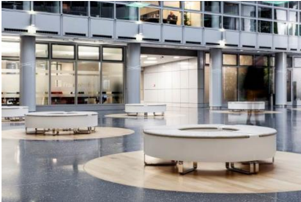
Rosskopf + Partner_Spreepalais_6.jpg

Insgesamt 18 Hocker wurden für das Spreepalais am Dom von Rosskopf + Partner gefertigt.