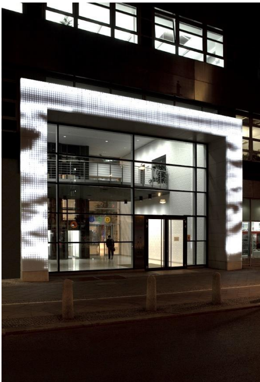
Rosskopf + Partner_Schönhauser Tor_2 Hinterleuchteter Torbogen aus Mineralwerkstoff in Berlin

Die Fotos können bei P3N MARKETING GMBH angefordert werden.