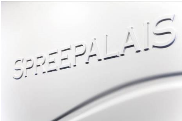
Rosskopf + Partner_Spreepalais_10.jpg

Der Schriftzug wurde von Rosskopf + Partner ausgefräst und mit Abstandhaltern vor das Wellenmuster gesetzt.