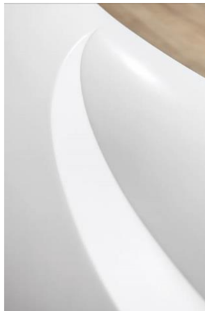
Rosskopf + Partner_Spreepalais_4(_5).jpg

Die auf der Innenseite rundum eingelassene LED-Leuchtlinie dient als Arbeitsplatzbeleuchtung. Auf der Außenseite wurde eine Handtaschenablage in die 3D-gebogene Front integriert.